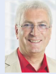
Liebe Bürgerinnen und Bürger,