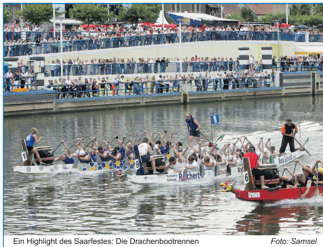
Ein Highlight des Saarfestes: Die Drachenbootrennen

„Sag's dem Chef“: Transparenz und Dialog sind dem Geschäftsführer der Stadtwerke Völklingen wichtig. Deshalb gibt es auf der Homepage die Möglichkeit, ihm direkt zu schreiben. Ob Lob, Kritik, Fragen zu Produkten oder neue Ideen: Hier kann sich jeder einfach mit ihm in Verbindung setzen.