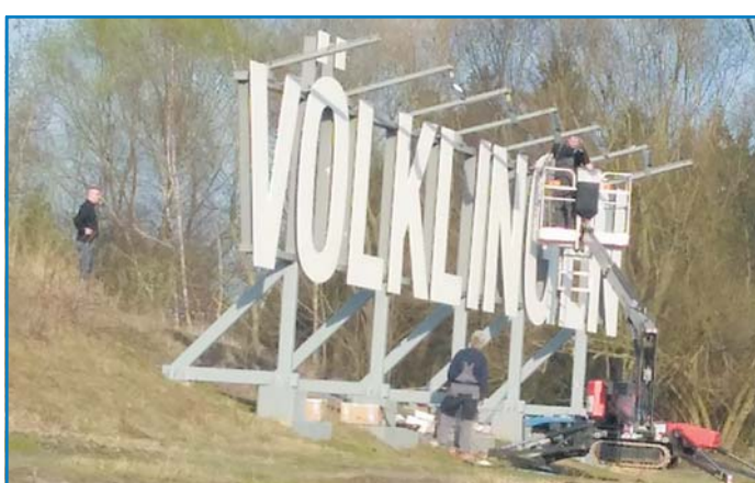
Mitarbeiter der Firma Tekad installieren die neue, energiesparende LED Beleuchtung

Strahlend weiß prangt der VÖKLINGEN-Schriftzug am Luisenthaler Saarufer bei Tag. Jetzt werden die überdimensionalen Buchstaben auch bei Dunkelheit wieder gut zu erkennen sein. Auf Initiative des Stadtmarketings der Stadt Völklingen hatte eine Gruppe von Asylbewerbers- und Qualifizierungsmaßnahmen (MIGRA-AGH) des Diakonischen Werks an der Saar die Großbuchstaben Ende des vergangenen Jahres neu gestrichen. Jetzt wurde eine neue Beleuchtungsanlage installiert.